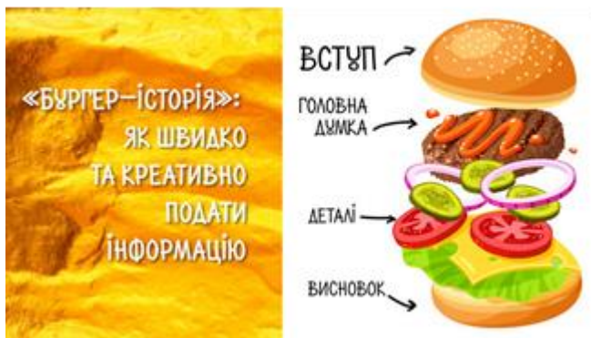
Рис 1. Гамбургер-модель.

дослідника, розглянемо його дію в моделюванні академічного тексту. Така проста метафорична модель уможливує з одного боку, наочно уявити текст як громадський продукт, а з іншого – виявити принципову різницю між тим, що зазвичай пишуть здобувачів і тим, що вони повинні писати, якщо хочуть стати справжніми дослідниками. Отже, уявіть собі гамбургер і, зібравши воедино всі наявні у вас уявлення про текст, позначте кожен його елемент в термінах академічного письма. Зверху і знизу гамбургера уявляється булочка, при чому розрізана навпіл, що цілком відповідають вступові і висновкам. Саме хлібна частина гамбургера утримує всю страву в цілісності, утворюючи певну рамку. Проте, булочка – це не гамбургер, інакше кажучи, вступ і висновок – це не сам по собі текст, а спосіб організації його змісту. Верхня частина булочки часто усипана кунжутом чи просто апетитно виблискує, а значить уже у вступі треба зацікавити читача. Основу гамбургера складає м'ясна частина – котлета, і в гамбургер моделі вона відповідає вашим креативним ідеям, позиції. Якщо їх немає, то немає і наукового (академічного) тексту. Іншими словами, рамка залишиться порожньою.