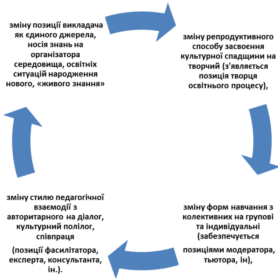
Рисунок 1. Зміна орієнтацій зі знаннєвої на особистісно-смыслову.

збирати й осмислювати інформацію, вибудовувати систему аргументів на захист своєї позиції, зіставляти різні точки зору. Гуманітарна культура педагога в особистісно орієнтованій парадигмі передбачає зміну орієнтацій зі знаннєвої на особистісно-смыслову (Рис. 1).