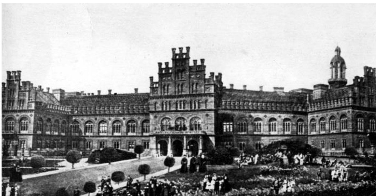
Рис. 5. Чернівецький університет. 1907 р.