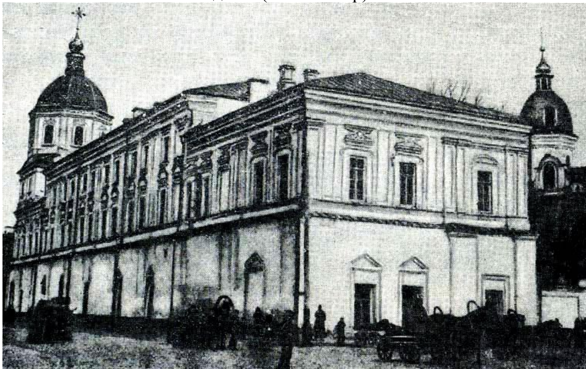
Рис. 2. Києво-Могилянська академія 1900 р.

Києво-Могилянська академія (1632-1805 р).