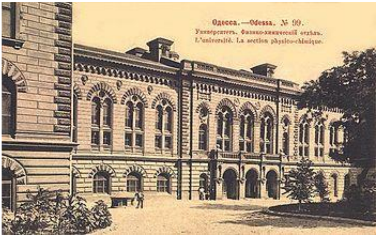
Рис. 4. Одеський університет. 1887 р.

Із початку свого існування університет мав історико-філологічний, фізико-математичний, юридичний і медичний факультети. Ініціатором відкриття Одеського університету був відомий учений-педагог М.І.Пирогов, а також М.М.Могилянський та генерал-губернатор П.Строганов.