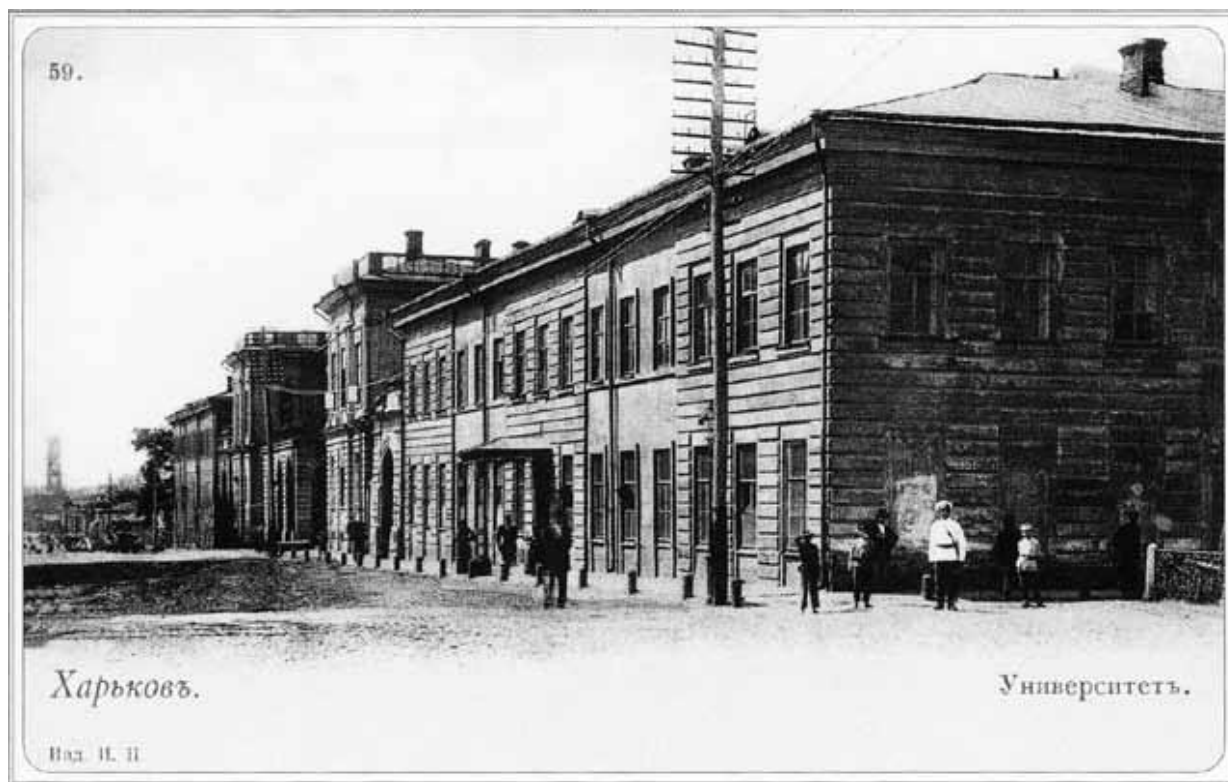
Рис. 3. Харківський університет. 1897 р.

пов'язана діяльність Петра Гулака-Артемівського, Григорія Квітки-Основ'яненка, вихованцем Харківського університету був Микола Костомаров.