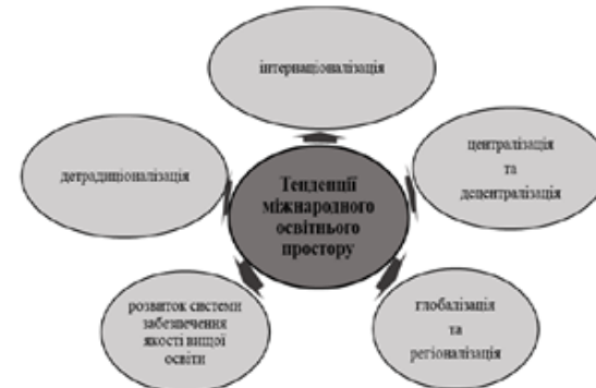
Рис. 1. Тенденції міжнародного освітнього простору, що актуалізують розвиток тьюторства у закладах вищої освіти

Серед основних тенденцій міжнародного освітнього простору, що актуалізують розвиток тьюторства у закладах вищої освіти виокремлюємо: