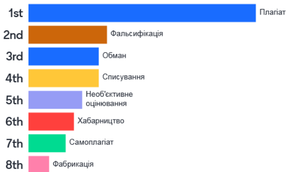
Рис. 1. Порушення принципів академічної доброчесності (загальна відповідь)