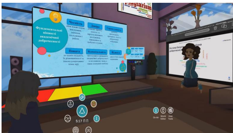
Рис. 4. Фрагмент заходу AltSpaceVR «Educational quest game «Академічна доброчесність: проблеми реалізації та відповідальність»

З початком епідемії коронавірусу освіта перейшла до дистанційного режиму, змусивши викладачів і здобувачів освіти поринути у світ прикладних програм і віртуальної реальності. Соціальна платформа AltSpaceVR є безкоштовною, має привабливий інтерфейс і функції, максимально пристосована для проведення освітніх заходів (Сипченко, 2021, с. 174). Програма надає достатній вибір дизайнів аудиторій і кімнат, а також простору, котрий можна доопрацювати, оформлюючи під тематику заходу, потреби та вподобання користувачів.