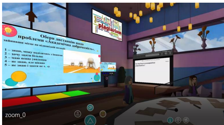
Рис. 3. Віртуальний простір AltspaceVR «Educational quest game «Академічна доброчесність: проблеми реалізації та відповідальність»