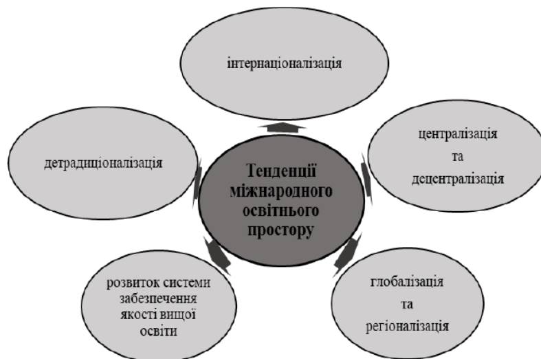
Рис. 1. Тенденції міжнародного освітнього простору, що актуалізують розвиток тьюторства у закладах вищої освіти