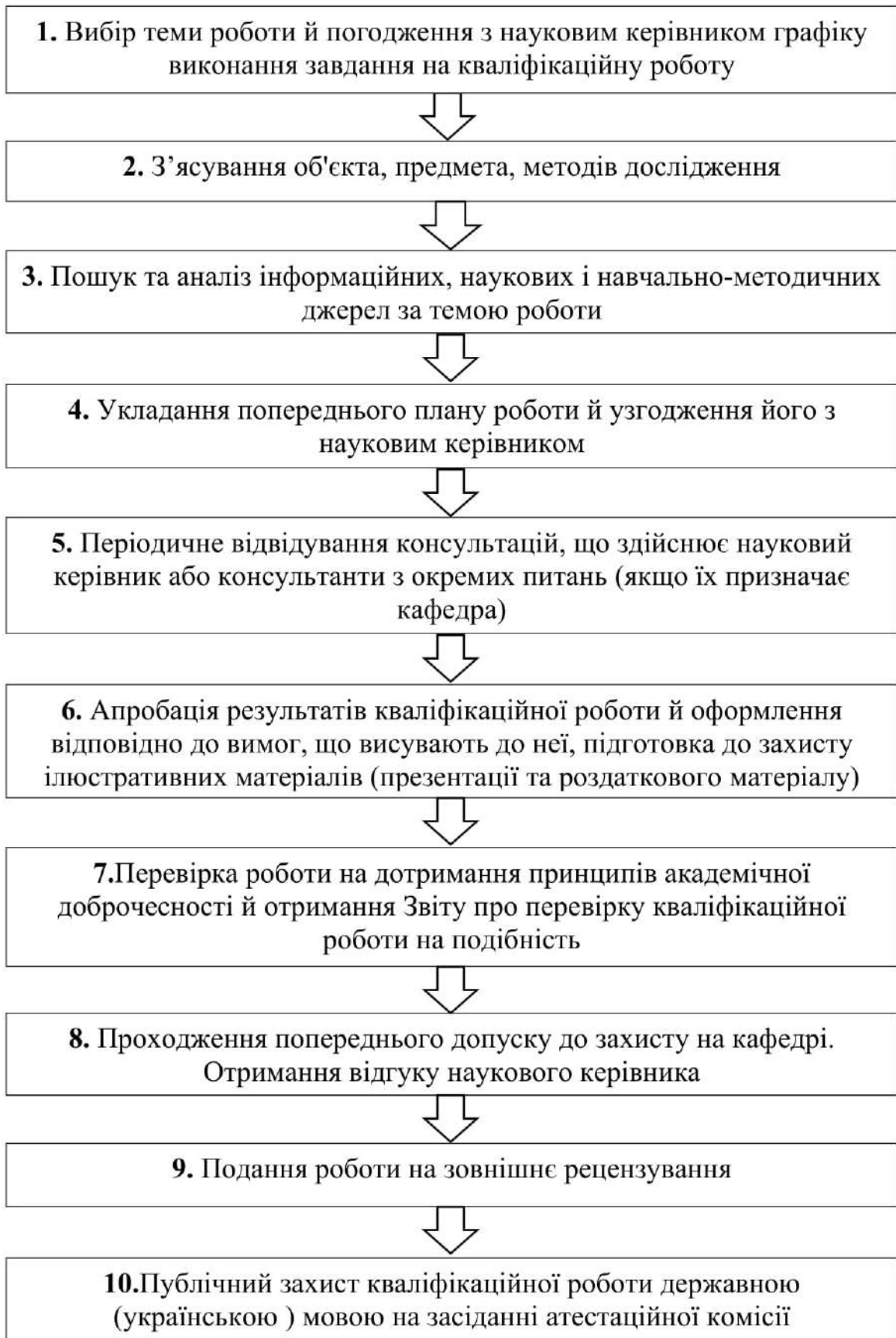
Рис. 2.2. Процес виконання кваліфікаційної роботи