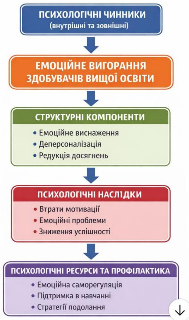
Рис. 1.1. Понятійно-логічна схема дослідження емоційного вигорання у здобувачів вищої освіти

Понятійно-логічна схема відображає системну організацію та структурно-функціональні зв'язки між ключовими категоріями дослідження емоційного вигорання у здобувачів вищої освіти, а також демонструє логіку переходу від теоретичного осмислення проблеми до її емпіричного вивчення. Запропонована схема ґрунтується на сучасних психологічних уявленнях про емоційне вигорання як складний багатовимірний феномен, що формується в процесі тривалої навчальної діяльності та взаємодії особистості з освітнім середовищем.