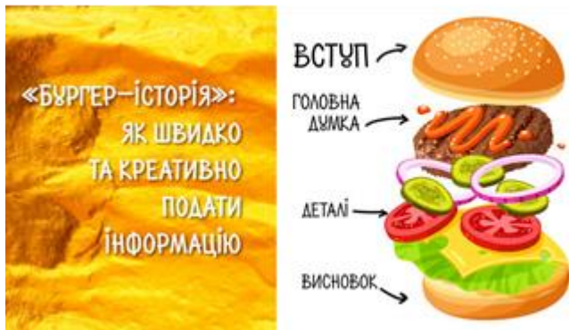
Рис 1. Гамбургер-модель.

Однак просто котлета в булочці – теж не гамбургер. Там є ще й гарнір, який робить його смачним і «істівним». Це підтримка ваших ідей, яка дозволяє читачеві засвоїти зміст. Якщо цих ідей немає, то ніякі факти (статистика, цитати, приклади та ін.) їх не замінять, точно так само як гарнір не може замінити собою м'ясо. Читач замість котлети отримає вінегрет в булочці і, природно, відчує себе обдуреним. Крім того, симетрія елементів гамбургер-моделі свідчить про те, що вступ і висновок міцно тримають текст. Вступ повідомляє про те, які саме ідеї і в якому порядку будуть розвиватися автором, а висновок представляє читачеві висновки з цих ідей. Таким чином, у вступі, основній частині й висновках ідеї будуть представлені в одному і тому ж порядку. Наприклад, якщо ідей три, то у вступі вони можуть бути перераховані як три проблеми в певному логічному порядку (наприклад, пріоритетність), потім ці три проблеми будуть розглянуті і вирішені в тій же послідовності в основній частині тексту і, нарешті, узагальнені і представлені в вигляді трьох висновків взаємопов'язано – перший, другий і третій. Розглянуту метафору організації тексту відноситься саме до есе, тобто до навчального науково-дослідного тексту. Есе як академічний, тобто навчальний науковий або науково-дослідний текст. Про його складові мова буде йти у наступних темах.